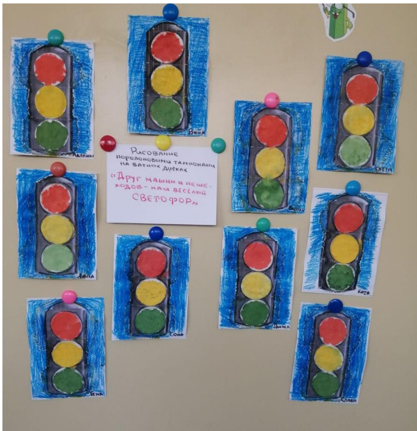
- младше-средняя группа